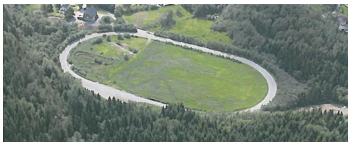
Figur 2 Travbanen på Kraft, Tranby