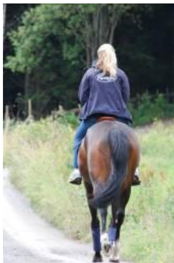
Figur 4 Denne voksne rytteren passerte bilen i god trav. Rytter rir uten hjelm, og har på seg joggesko.

66-72 % av de som blir skadet er kvinner/jenter. Kvinnene som ble skadet var betydelig yngre enn mennene. Den aldersgruppen med flest skader var de på 14 år.