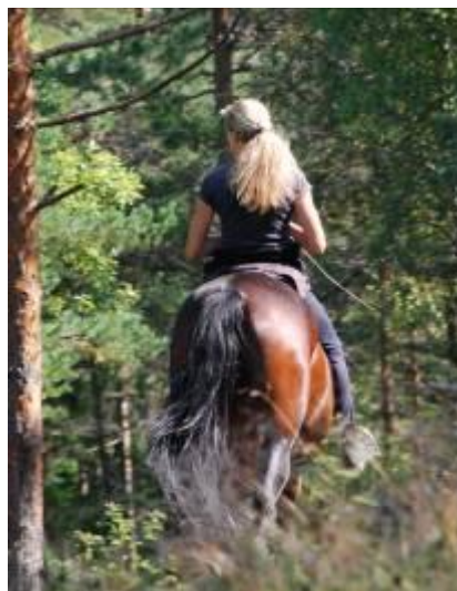
Figur 5 En voksen rytter vi møtte på langtur uten hjelm.