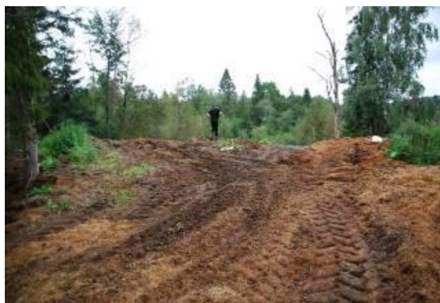
Figur 6 Viser en meget stor gjødselfødslinghaug som er deponert i skogen. Til høyre i bildet kan du se døde trær. Denne haugen var godt synlig på flyfoto.

I august 2011 var Landbrukskontoret og "Hest som næring" på en tre dagers befaring for å se på håndtering av hestegjødselfødsling i Lier. Vi var innom 20 gårder hvorav de aller fleste var staller. Resultatet var nedslående. Hestegjødselfødsling var flere steder deponert ved bekk, i skog og i skråninger mot elv. Trær i umiddelbar nærhet var døde og vegetasjonen og landskapet var sterkt påvirket av deponeringen. Utgangspunktet for å besøke disse stallene var at vi kunne se deponeringene på flyfoto.