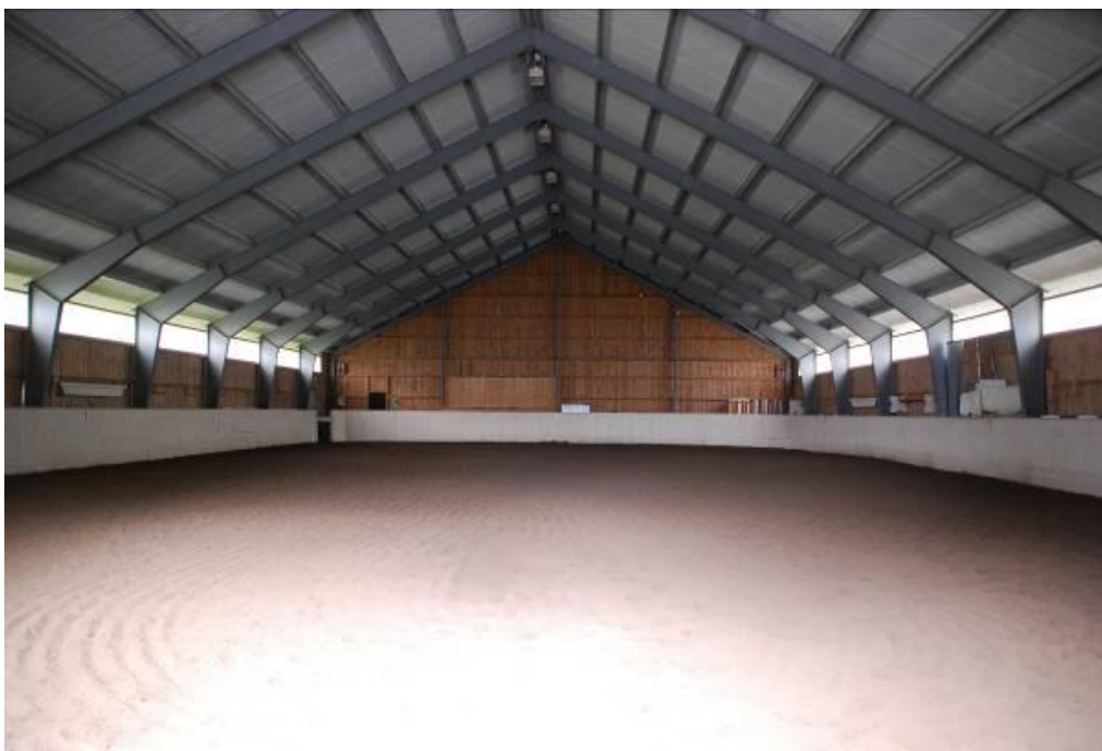
Figur 3 Ridehallen hos Stall Storemark